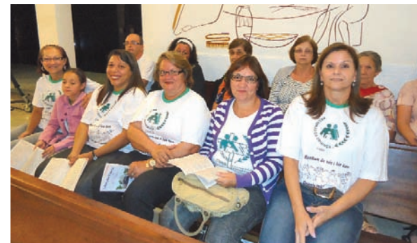
Líderes participam de missa na Rede Vida.

Os líderes da Pastoral da Criança do Setor Catanduva foram convidados para participar de uma missa especial na Rede Vida de Televisão. Representantes da Pastoral da Criança dos 19 Ramos do Setor participaram da celebração na sede da emissora de televisão, que fica em São José do Rio Preto, São Paulo. Foi um momento especial vivido por todos os líderes do Setor.