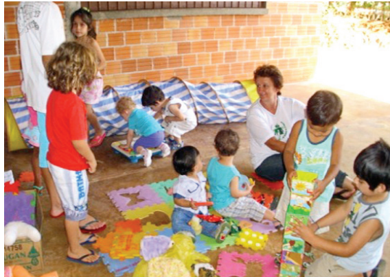
Palestra na comunidade.

No bairro Pacaembu, Paróquia São Cristovão, os líderes estão muito contentes e procuraram novas formas para dinamizar a Celebração da Vida e deu muito certo. Eles fizeram uma parceria com uma nutricionista e uma psicóloga para darem palestras sobre nutrição e obesidade, pois hoje temos mais crianças obesas do que desnutridas. As líderes brincavam com as crianças para as mães poderem ouvir a palestra. As mães fizeram muitas perguntas e esclareceram suas dúvidas. Assim, passaram a tarde trocando experiências.