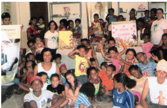
Celebração da vida especial.