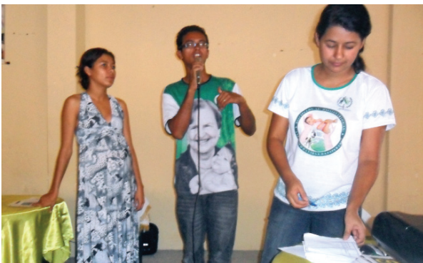
Voluntários participam de pesquisa.

A Universidade Federal do Rio Grande do Norte realizou uma pesquisa sobre a força voluntária no Município de Buíque, Diocese de Pesqueira. Durante a reunião mensal com os coordenadores de comunidade e líderes no município de Buíque, foi aplicado um questionário aos voluntários da Pastoral da Criança. Esta pesquisa busca conhecer as motivações dos voluntários da Pastoral da Criança da Diocese de Pesqueira. Hoje, Buíque conta com 570 líderes capacitados e 212 na equipe de apoio, em sua maioria, residentes na zona rural. Usando a metodologia de Jesus Cristo, Ver, Iluminar, Agir, Avaliar e Celebrar os líderes se fortalecem, sempre com a força da Mística que é permanente na Pastoral da Criança. Todos voltados para o objetivo comum: “que todas as crianças tenham vida e a tenham plenamente”.