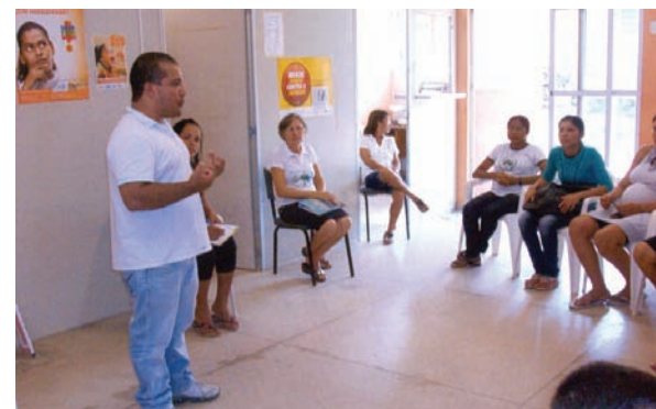
Palestra sobre aleitamento materno.