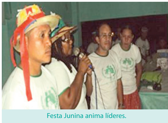
Festa Junina anima líderes.