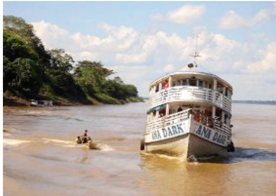
Barqueiros colaboram com a Pastoral da Criança.

Curioso nessa missão de salvar a vida das crianças é que as dificuldades dos acessos não são empecilhos para a Pastoral da Criança acontecer, de forma eficaz, na região. Até hoje, nenhuma coordenadora dos Ramos atrasou o envio das FABS e das prestações de contas.