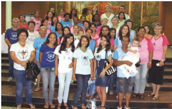
Participantes do mutirão.

Estamos aqui para relatar a todos uma união que vem dando certo em nosso Setor, nas nossas capacitações. Desde o ano de 2009, que o Setor Sinop está realizando os Mutirões de Capacitação, onde são realizadas várias capacitações ao mesmo tempo. Dessa forma, diminuímos o número de capacitações ao longo do ano. Durante esse Mutirão cada