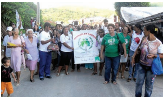
Caminhada de reivindicações.

No último dia 18 de junho 2011, a Diocese de Maceió, através de seu arcebispo Dom Antônio Muniz, articulou autoridades religiosas, gestores governamentais, entidades e lideranças da