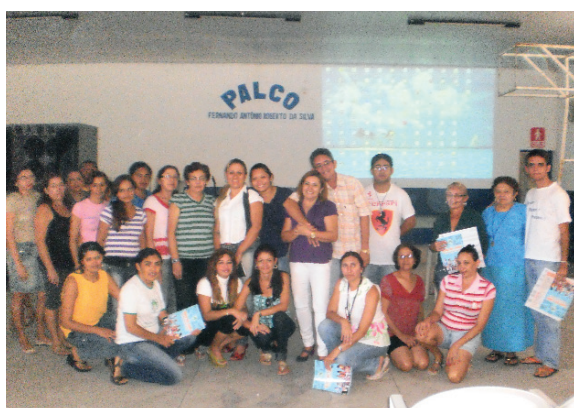
Participantes do Encontro.