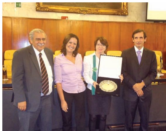
Pastoral da Criança recebe prêmio.

“O mais importante no nosso trabalho é a missão que assumimos, de discípulos missionários a exemplo de Jesus, com o objetivo maior de levar vida a todas as pessoas sem distinção de raça, cor, credo religioso e partido político. Cabe a nós