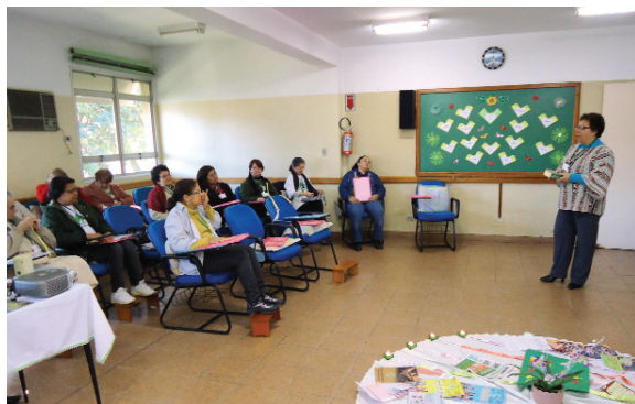
Coordenadores reunidos em assembleia.

A Pastoral da Criança da Região Episcopal Sé, realizou neste final de semana, 18 e 19 de junho, sua Assembleia Anual, na Casa de Encontro Lareira São José, Tremembé, com a presença das Coordenadoras Paroquiais, capacitadores e multiplicadores. O objetivo foi avaliar, planejar e animar o trabalho.