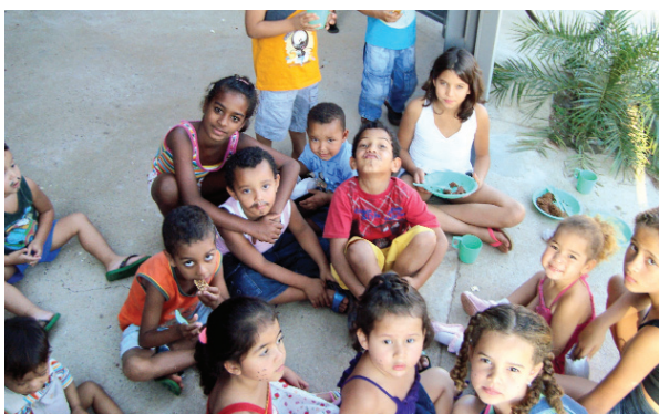
Nova comunidade com Pastoral da Criança.

O Setor de Três Lagoas está entusiasmado com a nova comunidade