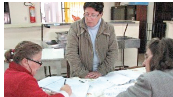
Capacitação em comunicação popular.